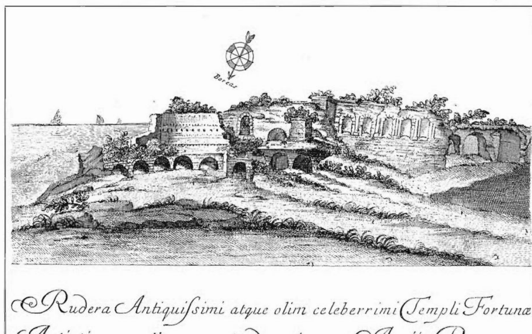
I ruderi che il Volpi attribuiva nel 1726 al «celeberrimo tempio della Fortuna Anziata», presso l'antico porto: camere a volta quasi sul mare e muraglioni a nicchie. Per Lugli non erano un tempio, ma più probabilmente magazzini del porto. (Incisione da Volpi, Vetus Latium Profanum III, 1726, riprodotta in Lugli 1940, fig. 18)

E di stipi votive, in città alta, ce n'era più d'una. Un censimento di Alessandro Maria Jaia, ripreso dalle indagini più recenti sul pianoro delle Vignacce, ha riconosciuto depositi in almeno quattro punti diversi: presso villa Spigarelli, nella proprietà Jacobelli all'incrocio tra via delle Mimose e via Coriolano, in una zona presso via Enea (venuta alla luce scavando le fondamenta di una palazzina) e, più di recente, tra via Roselle e via Anteo, sotto l'Istituto Don Orione, da cui proviene materiale oggi al Museo Nazionale Romano. Il sacro, qui, non stava in un punto solo: era sparso lungo tutto il ciglio del pianoro affacciato sul mare.